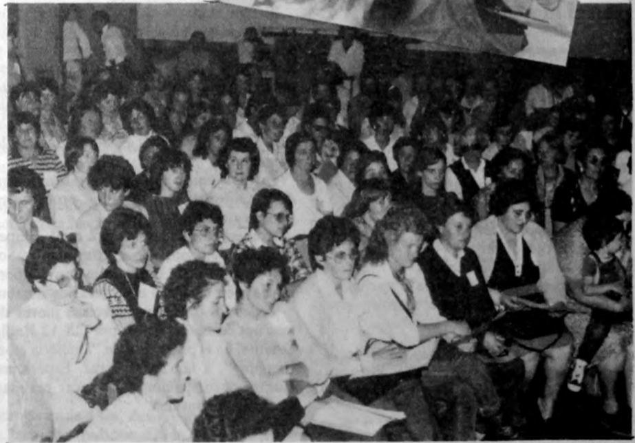
Comisión exponiendo su síntesis al Plenario (arriba) Plenario final del Encuentro (abajo)

Esta situación, le va creando a la mujer un individualismo que la aleja de su grupo social y también de su familia. Por ello nos proponemos transmitir nuestras inquietudes a las mujeres y hombres del medio rural.